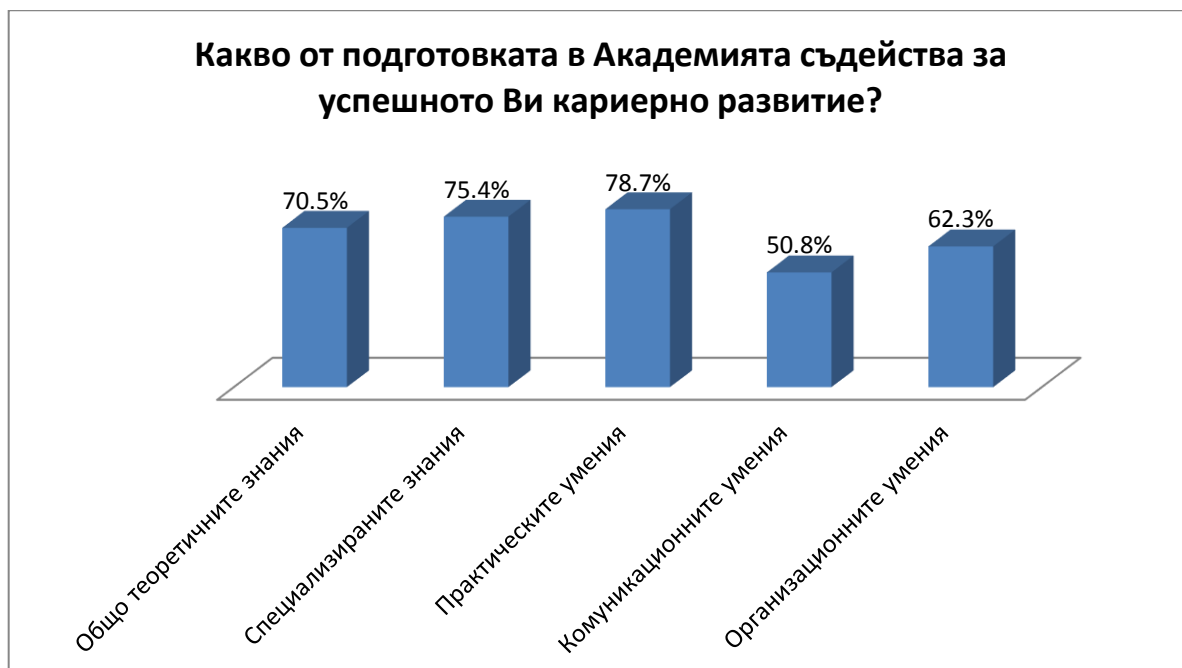
Диаграма 2 „Какво от подготовката в Академията съдейства за успешното Ви кариерно развитие?“

Във връзка с професионалната реализация на възпитаниците, от значение са трудностите, които срещат. На въпроса „ Трудности в процеса на професионалната ми реализация “ анкетираните са отговорили категорично, че „ Условията на работа /възнаграждение, изисквания, работно време, среда/ “ са определящи / 81.1 % /. В по-малка степен е застъпен отговорът: „ Необходимост от допълнителна квалификация “ – 24.5 % , а отговора „ Насищане на пазара на труда с кадри по моята специалност “ е най-маловажен за същите – 13.2 % /Диаграма 3/.