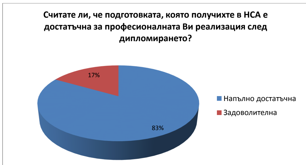
Диаграма 1 „Считате ли, че подготовката, която получихте в НСА е достатъчна за професионалната Ви реализация след дипломирането?“

Съществен за нашето проучване е въпросът „ Считате ли, че подготовката, която получихте в НСА е достатъчна за професионалната Ви реализация след дипломирането? “. 83 % от същите считат, че подготовката, която са получили в НСА е „Напълно достатъчна“, а 17 % са посочили отговорът „Задоволителна“. Прави добро впечатление, че отговорите „Недостатъчна“ и „Не мога да преценя“ не са отбелязани от анкетираните / Диаграма 1 /.